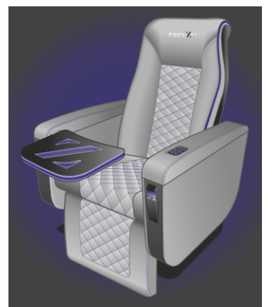
Illustration: Jan Seidl